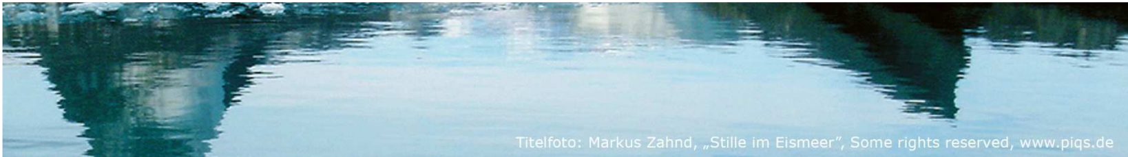
Titelfoto: Markus Zahnd, „Stille im Eismeer“, Some rights reserved, www.piqs.de